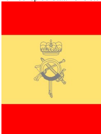
Oude Spaanse vlag.